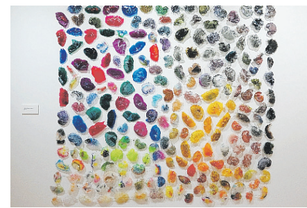
Luis de la Rosa Chapel