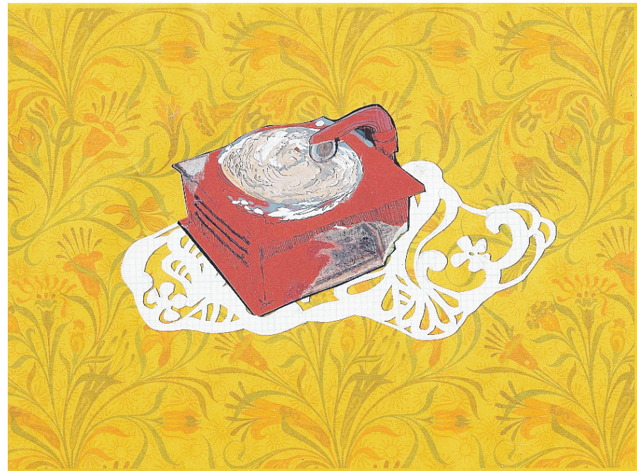
Meteoro ARSENAL DE LA MARINA

EL RESULTADO de largas jornadas de trabajos en talleres —algunos con boleros cortavanas o piezas clásicas de fondo— llegó a su fin. Esculturas, fotografías, instalaciones y pinturas llegan a distintas galerías y espacios culturales en el país para que el público se exponga a la creación viva.