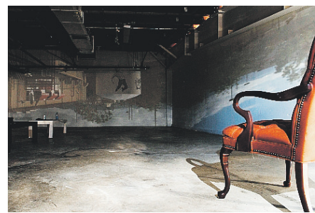
Troche y el tanque ÁREA, LUGAR DE PROYECTOS

Gallardo trabajó desde calados en papel, que se asemejan a las vistas del huracán desde un satélite, hasta ins-