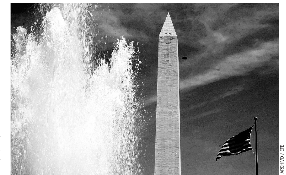
EN EL 2004, se inauguró en Washington D. C. un monumento conmemorativo de la Segunda Guerra Mundial.

Hubo además un cambio cultural, pues hubo migración del campo a la ciudad y 65,000 puertorriqueños fueron reclutados como soldados, y, al haber menos hombres, muchas mujeres pudieron ocupar empleos tradicionalmente de hombres, entre otros”, elabora el académico, quien espera que el libro sirva al propósito de desentrañar el impacto en la Isla de la guerra más sangrienta y geográficamente más abarcadora de la historia.