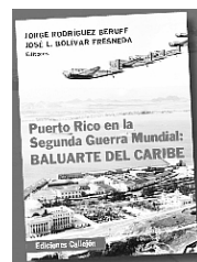
PORTADA DE la publicación que se presenta esta noche en la FLMM

Temas como el papel de Rexford Tugwell, Luis Muñoz Marín, la propaganda y cobertura de la prensa, así como el bloqueo alemán y sus efectos en la Isla son algunos de los temas que se tratan en el volumen, que será presentado esta noche a las 7:00 p.m. en la Fundación