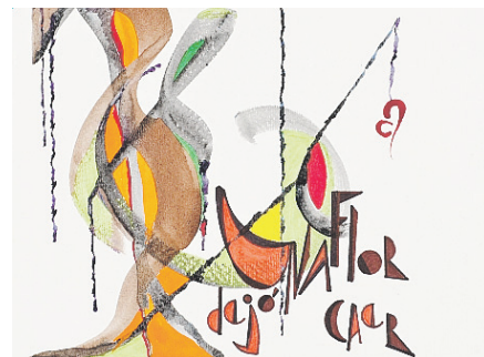
Suite para Boleros CASA DE ESPAÑA

Ella comenta que en los quince óleos que exhibe se invita a un viaje por los sueños y las vivencias humanas. Cinco imágenes no incluidas en la muestra se venderán en formato giclée , y parte de los recaudos serán destinados a Helping Hand Foundation, entidad que ayuda a niños con enfermedades catastróficas. Galería Topacio está ubicada en la Ave. Cementerio Nacional #53, en Hato Tejas, Bayamón. Información en el 787-780-7839.