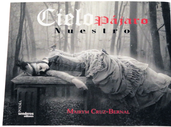
CIELOPÁJARO NUESTRO Mayrim Cruz-Bernal Bogotá: Senderos Editores, 2012

Estas son columnas valientes que contribuyen al diálogo necesario que debe establecer toda sociedad entre sus diversos componentes. Su propósito principal es identificar los males que la aquejan, analizar su proveniencia y proponer soluciones lógicas. (CDH)