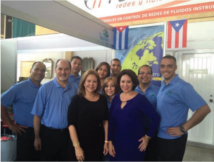
¡Felicidades Danosa por ese merecido premio!

Fue una experiencia enriquecedora de mucho aprendizaje. Entre los logros alcanzados está que Danosa Caribbean, la única empresa puertorriqueña que participó con exhibidor logró convertirse en ganadora de la medalla de oro en la categoría de "Calidad del producto".