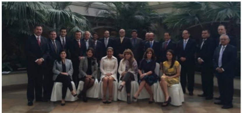
Líderes de AILA

Entre los temas discutidos en paneles y conferencias del Foro de Competitividad se encuentran: la importancia de la calidad en el clima de negocios, promoción del emprendimiento, innovación y desarrollo, erradicación de la corrupción, integración regional, liderazgo del sector privado en el desarrollo económico y cooperación comercial entre sector privado de la región.