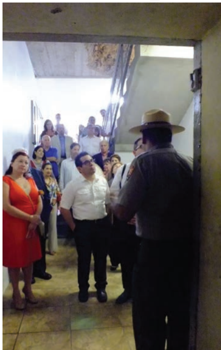
Durante el recorrido por el Castillo.

El 15 de octubre el área del Castillo San Cristóbal utilizada por la armada de los Estados Unidos durante la Segunda Guerra Mundial, fue escenario para la presentación del libro "Island at War", en una actividad de la Región Metro Este. Además de la presentación del libro se ofrecieron recorridos guiados por el Castillo e intercambio de negocios entre los participantes.