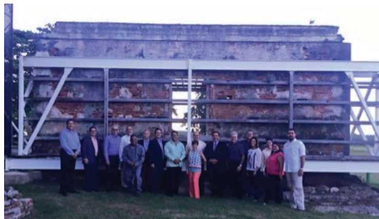
Miembros de la Junta frente al trapiche.

Continuando con nuestro compromiso con el Fideicomiso de Consevación, nuestra reunión de Junta del 14 de octubre se llevó a cabo en la Hacienda la Esperanza en Manatí. Fue una experiencia enriquecedora.