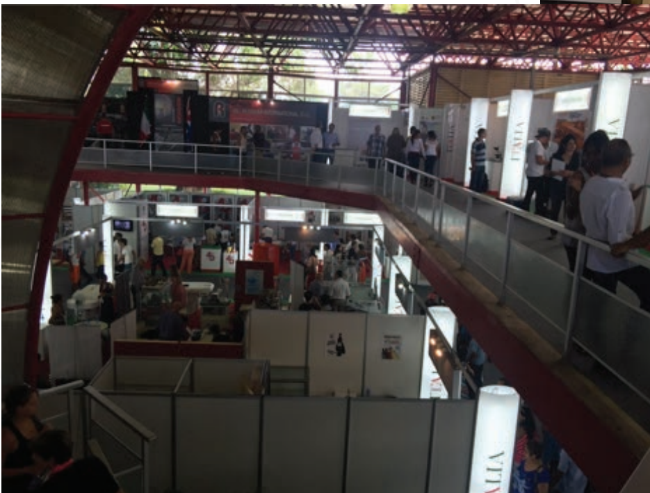
Parte de los pabellones.

La feria tuvo gran representatividad de países.