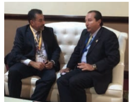
Reunión con presidente de FECAICA