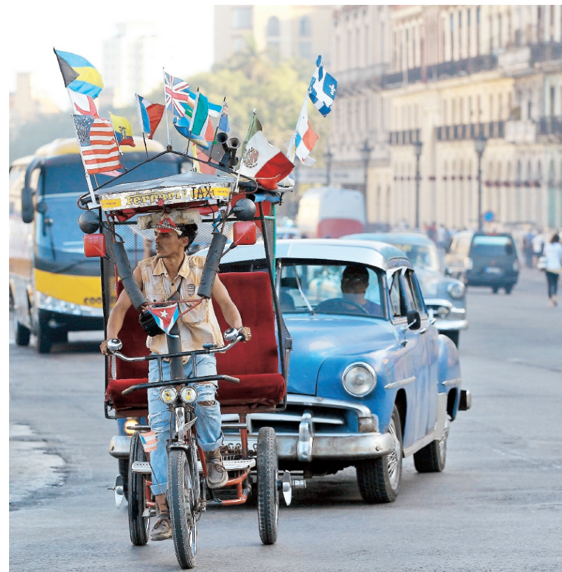
El trabajo por cuenta propia se añadió recientemente a la estructura económica cubana.

“Los dos países han tenido siempre relaciones de amistad y solidaridad muy fuertes pero quedaron distantes en la economía y los negocios por la condición de Estado Libre Asociado de Puerto Rico, y las leyes de Estados Unidos han sido un obstáculo entre los hombres de negocios de las dos islas”, señaló el economista cubano.