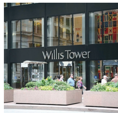
WTW en Puerto Rico se enfocará en estrategias de cuidado de salud.