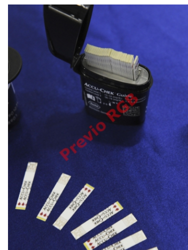
Las nuevas tirillas para medir el azúcar tendrán 10% de error.

“En el caso de Roche, tenemos una negociación con la Compañía de Fomento Industrial donde hay un in-